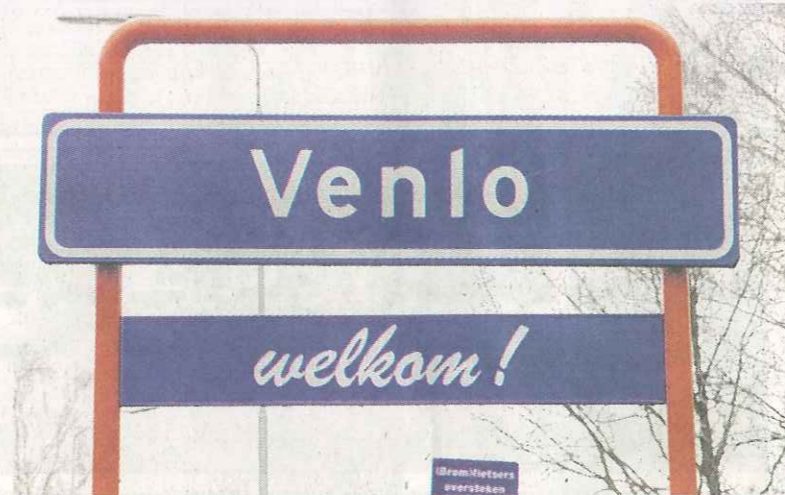
Deutsche Arbeitssuchende sind in Venlo willkommen.

Während der Arbeitsmarkt in der Vitustadt seit Jahren bei einer Arbeitslosenquote von 15 Prozent verharrt, boomt die Wirtschaft im Nachbarland. „Wir suchen fast alles“, sagt Weijs. „Vom Architekten, Informatiker und Ingenieur bis hin zum Lagerarbeiter und Kfz-Monteur.“ Rechtliche und bürokrati-